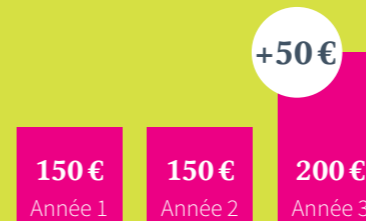
EXEMPLE D'AUGMENTATION DU REMBOURSEMENT POUR UNE FORMULE 5

Pour l'optique, si vous n'avez pas eu de remboursement les 2 premières années, nous améliorons vos garanties la 3 e année.